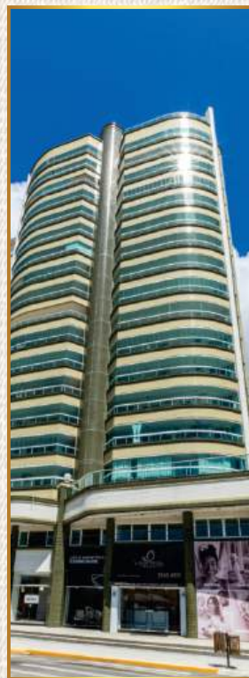
Ile de France