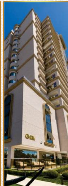
Palazzo del Mare