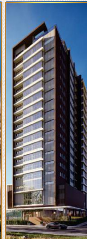
Cill Boulevard (em construção)